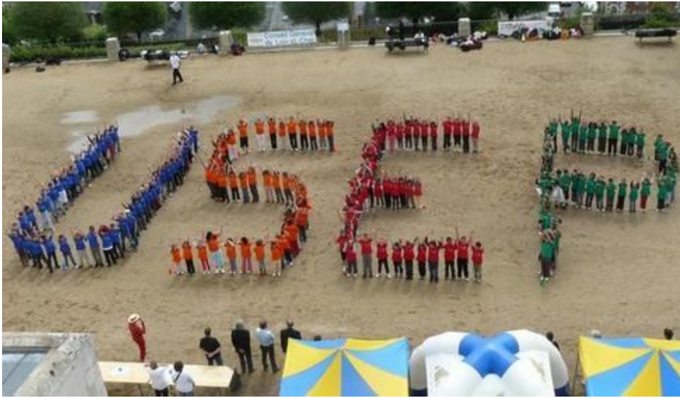
L'Usep 41 fêtera ses cinquante ans en 2015.